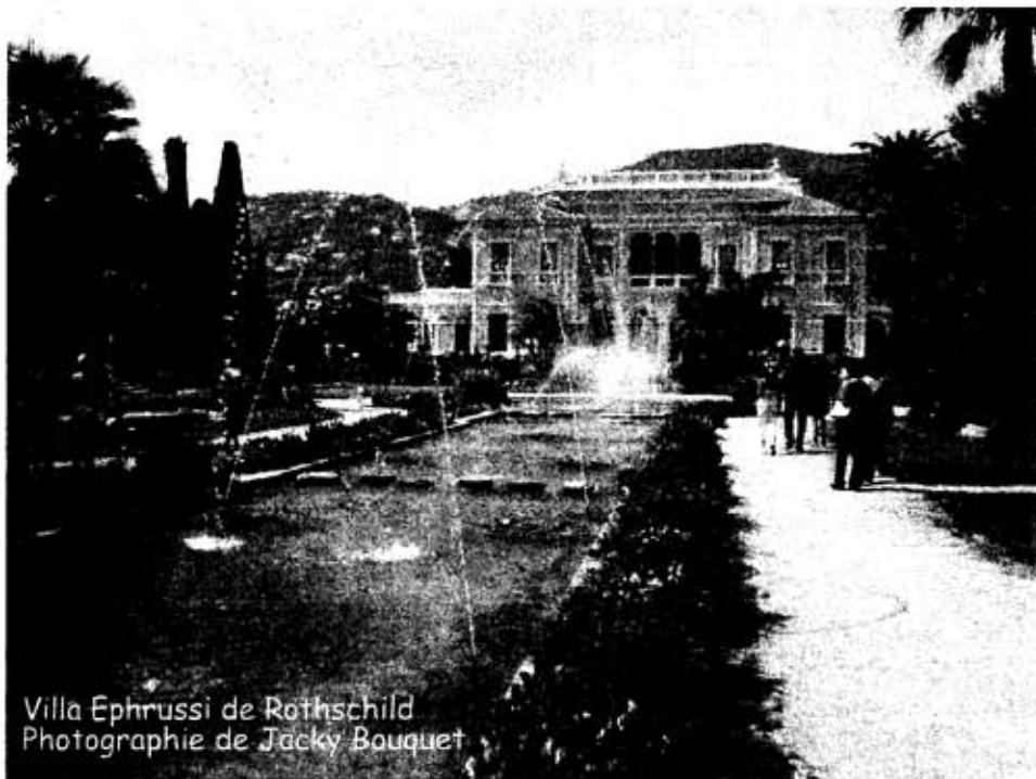
Villa Ephrussi de Rothschild