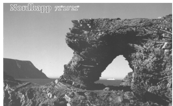
Nicole Pondiscia, Patrick Bonin, sont allés au frais au Cap Nord