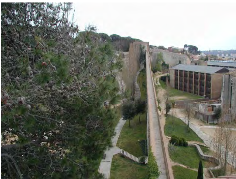
Chemin des murailles.

Visite de Gérone : Traversée de l'Onyar, puis montée vers « San Feliu », Saint patron de la ville et ancienne collegiale érigée sur des fondations romanes. 8 Sarcophages paléochrétiens sont logés dans l'abside, dont deux historiés. Nous sommes passés devant les bains arabes , construits à la fin du 12 ème . Au dessus des bains, le « Passeig Arquéològic » anciens remparts romains reconstruits au 14 ème et 19 ème