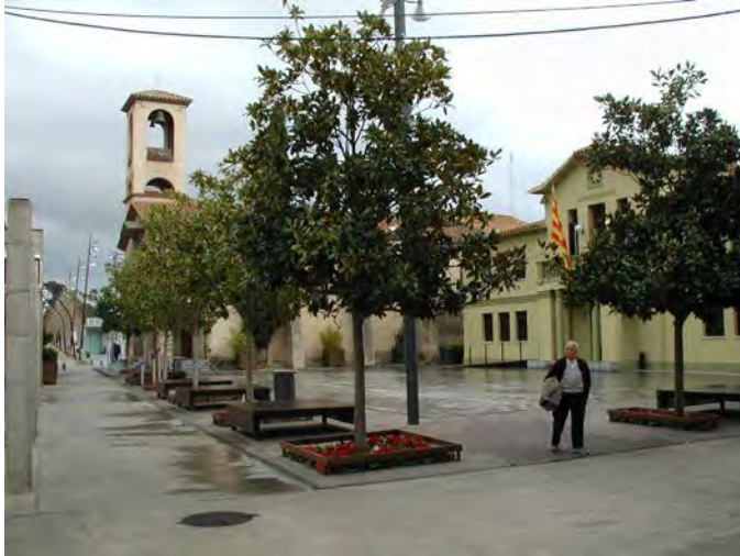
Place du village : Mairie, église

Départ très tôt le 31 Mars, arrivée vers 14h, sous la pluie. Nous prenons possession des lieux et partons visiter la petite localité « Santa Suzanna » que des hôtels, la plage sale et vide, le vent froid... rien pour plaire, d'accord, nous sommes partis du mauvais côté !