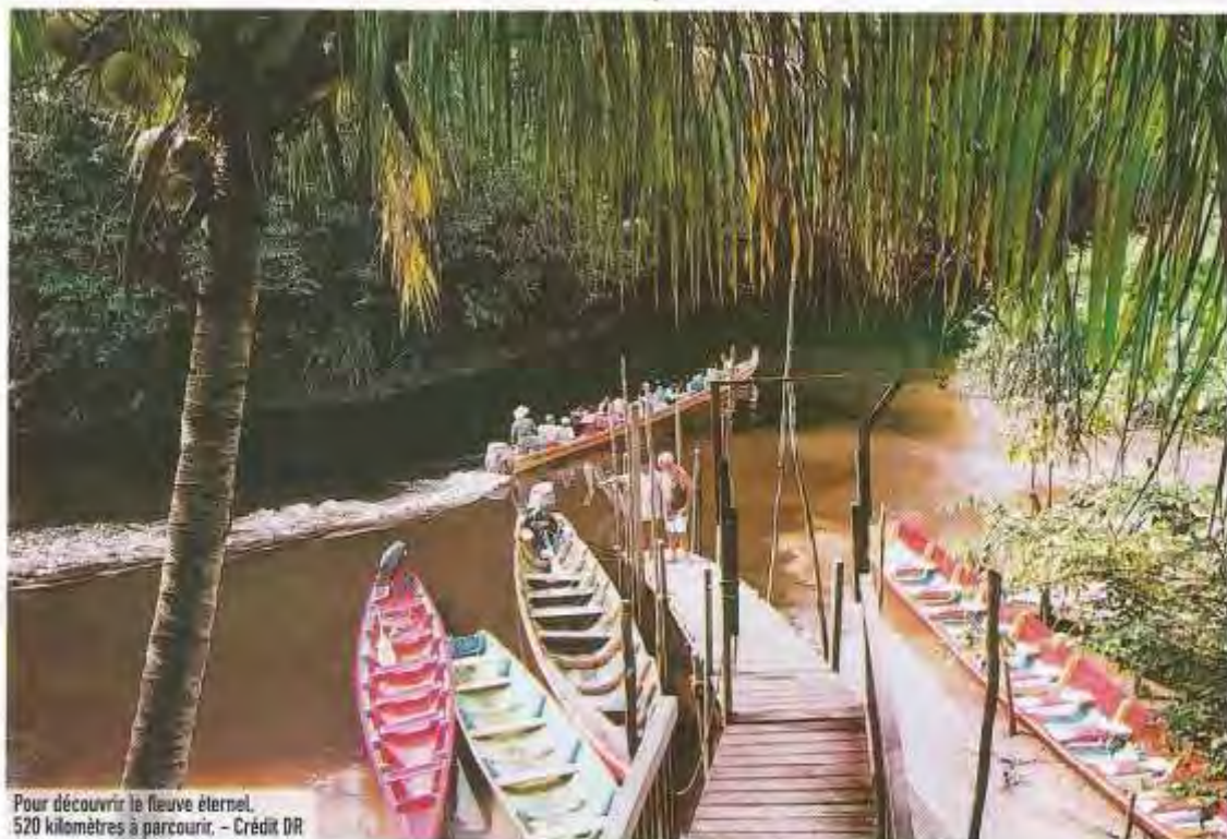
Pour découvrir le fleuve éternel, 520 kilomètres à parcourir.