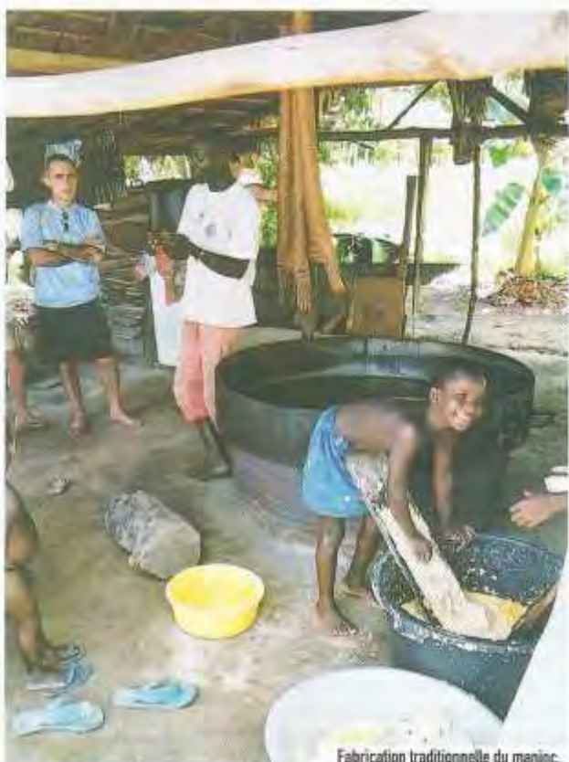
Fabrication traditionnelle du manioc.

La Guyane compte un artisanat riche et diversifié. Lors de votre découverte d'un village amérindien, ne manquez pas de rapporter vannerie et ciel de case (ou maluana), une pièce ronde en bois précieux. Coloré, il sera du plus bel effet. Côté bushinengué, l'art tembé offre également de très belles pièces. Pour les amateurs de farniente, craquez pour le hamac ! Enfin, le rhum guyanais, moins connu que les antillais, est aussi de belle tenue : à goûter (avec modération) la Belle Cabresse. Ça fait rêver, non ? www.infos-guyane.com/tag/sanumacas