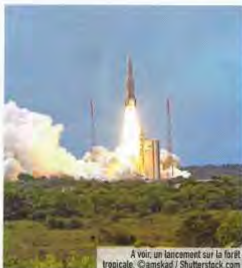
À voir, un lancement sur la forêt tropicale.

À Kourou, se trouve le Centre spatial guyanais, base de lancement française et européenne. Après Ariane V, le site s'est enrichi récemment de deux nouveaux lanceurs : Soyuz et Vega. Depuis juillet 2011, le Centre national d'études spatiales propose différentes formules de visite (les trois lanceurs, Soyuz uniquement ou Ariane V et Vega) plusieurs fois par semaine. Les visites sont gratuites et ouvertes à tous. En période de lancement, on peut se rendre sur la montagne Carapa, pour voir s'envoler la fusée. En soirée, les lumières du décollage donnent à la forêt alentour des couleurs uniques. Le souffle est suspendu le temps d'un moment rare. www.cnes-csg.fr/