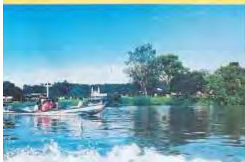
En taxi-pirogue sur le fleuve Maroni.

Le taxi-pirogue : En mode aventurier pour admirer la beauté du pays, le long des fleuves. Sans nul doute la façon la plus agréable de se déplacer et voir du pays.