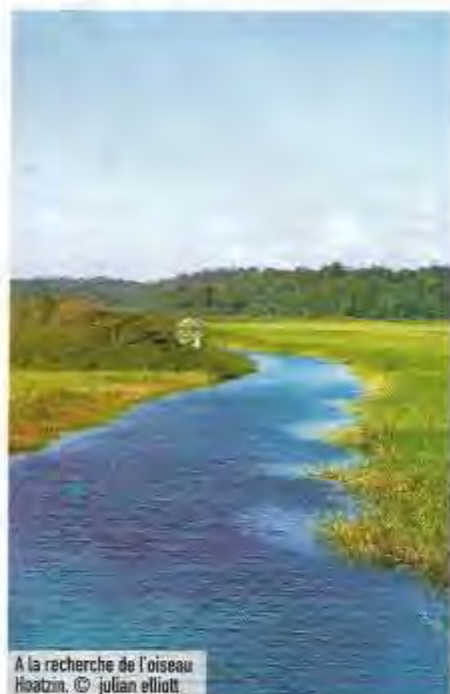
À la recherche de l'oiseau Hoatzin.

Une très belle réserve de 94 700 hectares comptant une biodiversité remarquable. Ses marécages abritent une des deux dernières populations stables de caïmans noirs d'Amérique du Sud ainsi que d'autres espèces telles que le caïman-nain de Cuvier, le Caïman-à-lunette et le Caïman-à-front. C'est aussi le lieu privilégié pour l'observation des oiseaux. On y trouve l'Hoatzin, l'unique oiseau ruminant au monde. Un univers naturel et préservé. www.marais-kaw.com