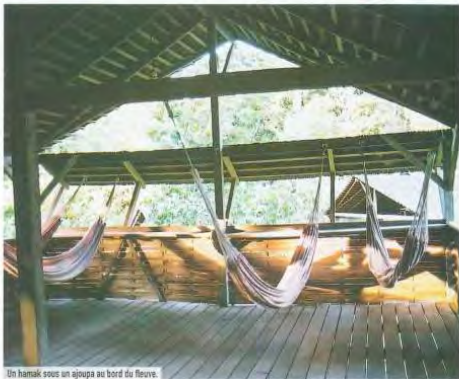
Un hamac sous un ajoupa au bord du fleuve.