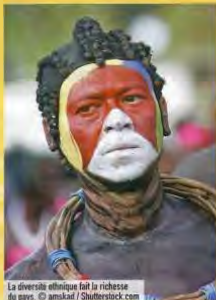
La diversité ethnique fait la richesse du pays.