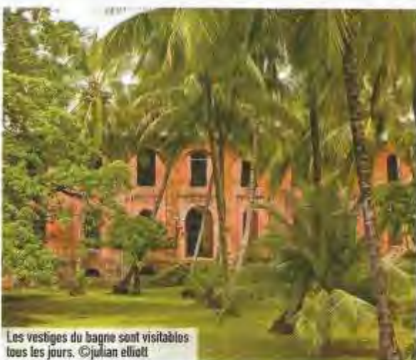
Les vestiges du bagne sont visitables tous les jours.

Long de quelque 520 km, le fleuve Maroni forme une frontière naturelle à l'Ouest de la Guyane avec le Surinam. De Saint-Laurent du Maroni, des piroguiers emmènent les visiteurs en une journée jusqu'à Apatou, voire en 4 jours, jusqu'à Maripasoula. Des haltes s'opèrent dans des villages préservés : Grand Santi, Papaïchton où vivent des populations ancestrales noires marrons et amérindiennes. Des départs sont aussi possibles pour des randonnées pédestres dans la forêt avec baignades et nuits en hamac sous les caribets. www.tousenpirogue.com/