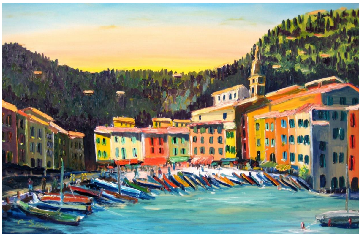
Port de Portofino

Siège social : Chez Monsieur J-Marie CRUVELLIER 65, Chemin Saint-Pierre -La Castellane 83190 OLLIOULES Siret : 514 673 763 000 17